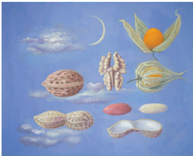
Floating , 2016, Öl auf Leinwand, 80 x 100 cm