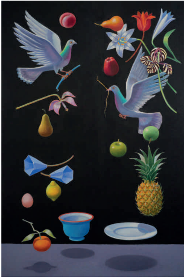
Fliegendes Stilleben II , 2016, Öl auf Leinwand, 120 × 80 cm