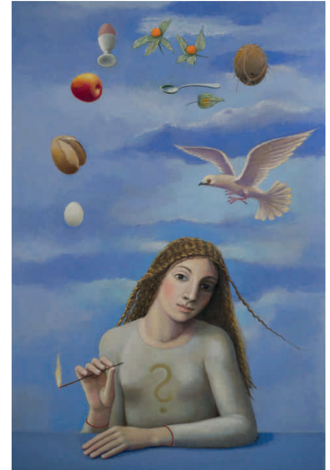
Die Frage , 2016, Öl auf Leinwand, 120 × 80 cm

Zur Finissage am 15. Juli ab 18 Uhr spielt Chaouki Smahi auf der Oud